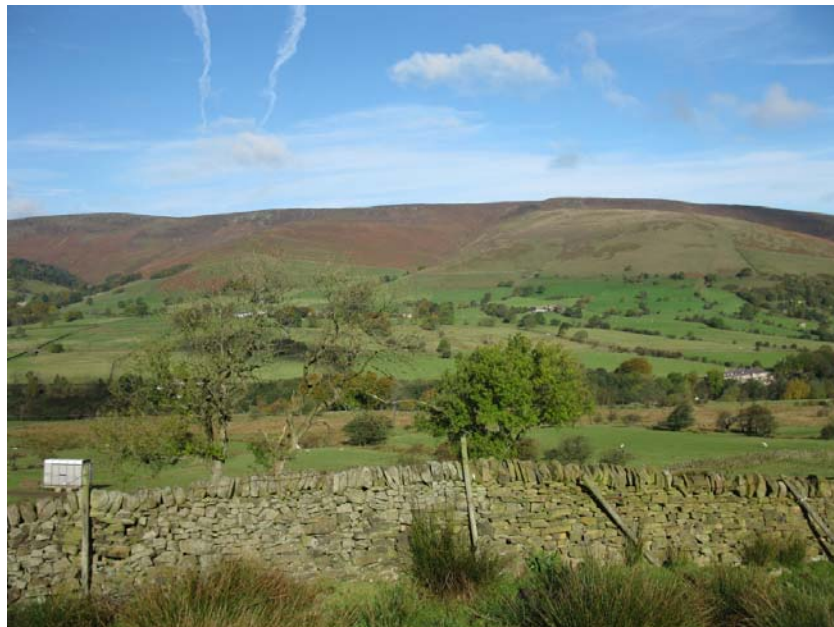
PEAK DISTRICT NATIONAL PARK